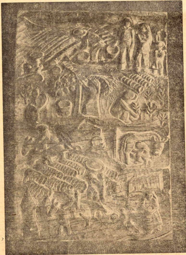
אמריקה (חיתוך עץ)

האמריקוטרופיזם, הפרזיטיזם הנוכחי בין כך ובין כך סופו מביא עלינו אבדון וכלייה. אולי ייבש לשדו, או עודף-לשדו, של הצמח שאליו נטפלנו ובו דבקנו; אולי מסיבות חיצוניות תקרענה את שלוחות-היניקה. אם כך ואם כך נדונים אנו לחורבן כלכלי וצבאי, לאחר שיושלם תחילה חורבננו הנפשי, הרוחני, התרבותי. אני בוחר שנתמודד עם הסכנה הזאת כאומה, כצבור בן-אומה ובן-